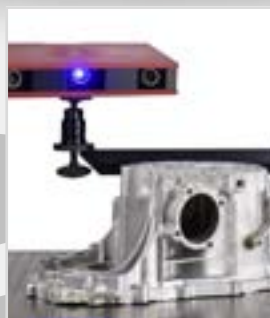
GOM - Atos 3D Scan-System

7-10-7 X 700 mm Y 1000 mm Z 660 mm Messunsicherheit: 1,5 + 3 * L/1000