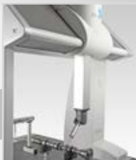
DEA Global Performance

Wir vermessen optisch, tastend oder mit Laser, seien es kleinste oder große Teile bis 1.400 mm. Überzeugen Sie sich gerne vor Ort von unseren Möglichkeiten.