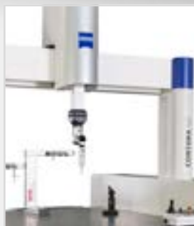
Zeiss Contura HTG