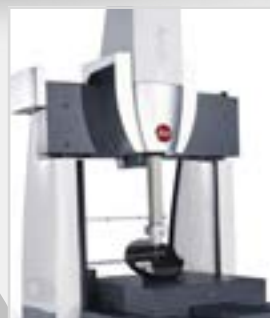
Leitz PMM-C 1000

X 60 mm Y 170 mm Z 700 mm Software: GOM Inspect V8