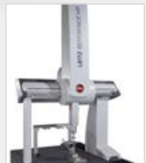
Leitz Reference HP

16-12-10 / B3 X 1600 mm Y 1200 mm Z 1000 mm Traglast 2t Messunsicherheit: 1,2 + L/400 betrieben mit Quindos7 (V 7.10.14363)